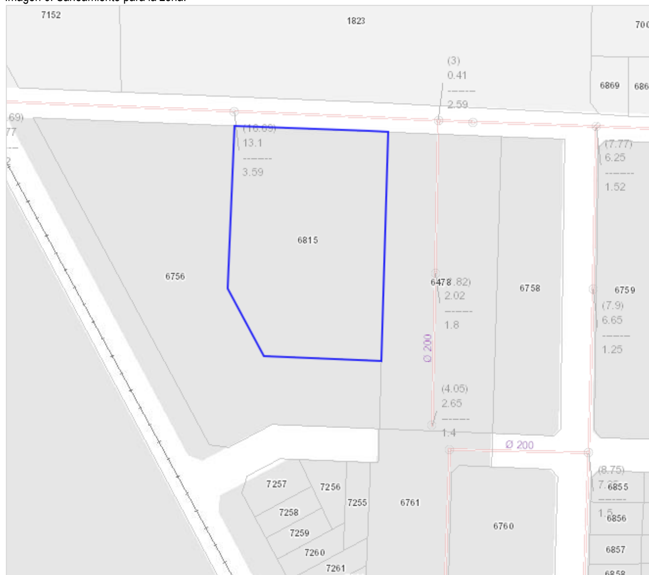
Imagen 6: Saneamiento para la zona.